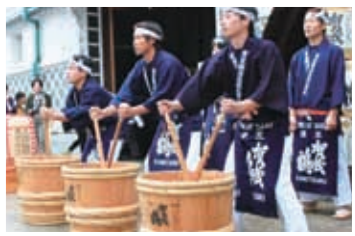
酒まつりのイベントの様子

毎年10月の第2土曜日・日曜日には市内最大級の祭り「酒まつり」が開催されます。全国900銘柄の地酒の試飲が楽しめる酒ひろばや、酒蔵通り周辺の蔵元で開かれる趣向を凝らした酒蔵イベント、酒造りの蔵人の賄い料理を基にした名物料理「美酒鍋」が味わえる美酒鍋会場など、酒都西条の魅力を楽しめる祭りとなっています。