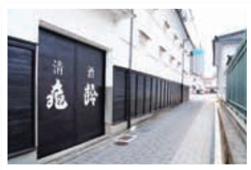
白壁のきれいな酒蔵通り

僕の地元、東広島市の西条町は灘・伏見と並び称される銘醸地であり、JR 西条駅の周辺では8社の蔵元が醸造を続けています。経済産業省の「近代化産業遺産群続33」にも認定されている酒蔵通りでは、林立する赤レンガの煙突・赤瓦の屋根となまこ壁・白壁とが織りなす独特の景観を楽しむことができます。酒の仕込みの時期には、やわらかいお酒のいい香りが酒蔵通りを漂います。また最近では酒蔵を改装したカフェや料理店、酒やその仕込み水を使ったスイーツや料理を出す店もあり酒を楽しむつくことができる街です。